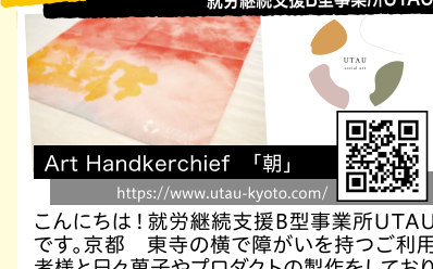
Art Handkerchief 「朝」 https://www.utaau-kyoto.com/

こんにちは！就労継続支援B型事業所UTAUです。京都 東寺の横で障がいを持つご利用者様と日々菓子やプロダクトの製作をしています。「就労支援施設」と聞くと軽作業を請け負っている、どこか暗いイメージをもつ方も多いかも知れません。私たちの施設では【好きを仕事に、魅力を世界に】を掲げ、障がいをもつアーティストと一緒にものづくりをしています。