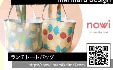
ランチトートバッグ https://nowi.mamikoimai.com

デザイン・商品企画・作製業務を行っています。デザイン・イラスト業と、自身の商品ブランド「nowi」小売卸売業。北欧デザインから影響を受けた、生活を彩る優しく丁寧なものづくりを心がけています。