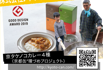
京タケノコカレー4種 (京都缶・環づめプロジェクト) http://kyoto-can.com/

自然環境コンサルタント。 近年では里地に近い自然環境の再生としてサステナブルな商品の開発を行いながら地域づくりを目指しています。