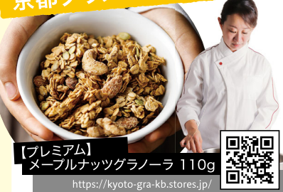
【プレミアム】 メープルナッツグラノーラ 110g https://kyoto-gra-kb.stores.jp/

1863年、あるアメリカの栄養学者が「患者さんのために栄養価の高い食事を」との想いで誕生したグラノーラ。時を超え、ふたたび、京都グラノーラ工房で「罪悪感のない健康的なおやつ」として生まれ変わりました。