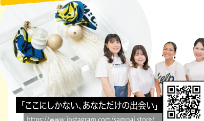
「ここにしかない、あなただけの出会い」 https://www.instagram.com/sampai.store/

「産廃を減らす、想いを紡ぐ」がコンセプトのハンドメイドブランド。京都・西陣の伝統産業や地場産業の生産過程で出る「産廃」を再利用したアクセサリを販売する。「sampai」の商品ストーリーをぜひ店頭で。