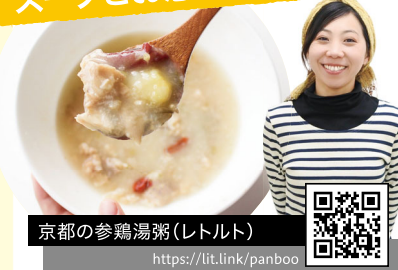
京都の参鶏湯粥(レトルト) https://lit.link/panboo

地元京都を中心とした無農薬野菜や、美山の平飼鶏の鶏ガラスープなどこだわりの食材をつかい、保存料や着色料・甘味料など化学調味料はすべて無添加。心と身体に優しいごはんをつくっています。