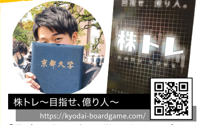
株トレ〜目指せ、億り人〜 https://kyodai-boardgame.com/

「遊びから知る、楽しく学ぶ」をコンセプトに、様々な「学び」×「ボードゲーム」の活動をしている「京大ボードゲ製作所」。第一弾ボードゲーム「株トレ」は資産運用のエッセンスを体験できるボードゲームです！