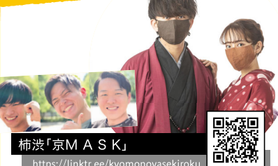
柿渋「京M A S K」 https://linktr.ee/kyomonoyasekiroku

京もの屋SEKIROKUはコロナ禍で被害を受ける京都の力になりたいという想いを持つ学生で開業しました。「京都の魅力の世界に」をモットーに京友禅の技術をつめ込んだ柿渋のマスクやコート販売しております。