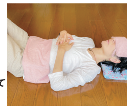
クロモジチップ無農薬玄米からだピロー

クロモジエキス抽出後のクロモジチップ の副産物や規格外のお米を使用し地球 の循環をうみだしています。研究を重ねて 出来上がりました。ピローを通して 大自然を感じて心身を癒されてください。