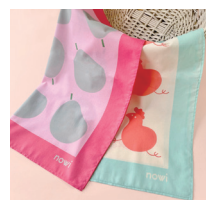
マルチコットンスカーフ

京都でデザイン・商品企画・製作を行っています。 デザイン・イラスト業と、自身の雑貨ブランド 「nowi」の小売卸売業。 商業施設やイベント出店販売など。 北欧デザインからインスピレーション を受けた、自由なフォルムとカラーバランス。 「見た人の生活を彩り、たのしくて 癒されるものづくり」に日々励んでおります。